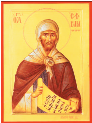
Прп. Ефрем Сирин.

В его творениях встречаются цельные картины жизни сирийских подвижников, главное место в которой занимала молитва и затем труд на общую братскую пользу, послушания. Целью своих подвигов иноки считали Богообщение и вселение Божественной благодати в душу, настоящая жизнь была для них временем плача, поста и трудов.