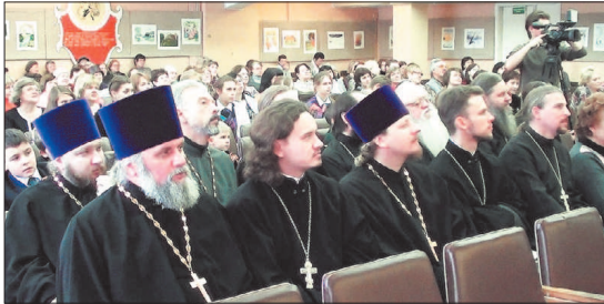
На открытии Рождественских чтений присутствовали священнослужители Ступинского и Малинского благочиний.

29 ноября в Ступинском районе прошло торжественное открытие XI районных Рождественских образовательных чтений, которые в этом году объединяет тема: «Духовное наследие преподобного Сергия в истории и современной жизни России».