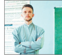
Священник готов к любому повороту разговора.

Уже не первый год продолжаются беседы на духовные темы со студентами Ступинского филиала «РосНОУ» и Ступинского авиационно-металлургического техникума им. А.Т. Туманова.