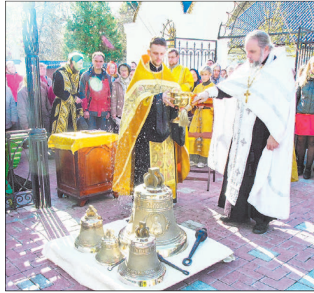
Торжественный чин освящения.

После того как новые колокола установили на место старых, звонари Тихвинского храма произвели пробный звон. Во время всенощного бдения в преддверии праздника Покрова Божией Матери новые колокола уже во всю мощь