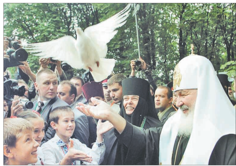
Патриарх Московский и Всея Руси Кирилл.

В эту светозарную ночь мы пребываем в жизнеутверждающем всеобщем ликовании, ибо событие, которое произошло много веков назад в дни древнего Иерусалима, имеет прямое отношение к каждому из нас. Более того, Воскресение Христово обладает поистине вселенским значением, ибо через него Спаситель даровал возможность обрести благодатное единство с Богом каждому открывшемуся на Его призыв: «Приидите, благословенные Отца Моего, наследуйте Царство, уготованное вам от создания мира» (Мф. 25, 34). Посему мы ныне со всеобщим ликованием вместе со Святым Духом Иаконом Златоустом: «Никто не рыдай от своего убожества, ибо для всех настало Царство!» Празднуя Светлое Христово Воскресение, мы свидетельствуем о правоте этих слов, ибо каждый человек, даже самый последний грешник, испуливший кровью Христа, имеет надежду на спасение. За наши грехи, как и за грехи всего человеческого рода, заплачет драгоценный кровью Распятого. Чтобы воспринять