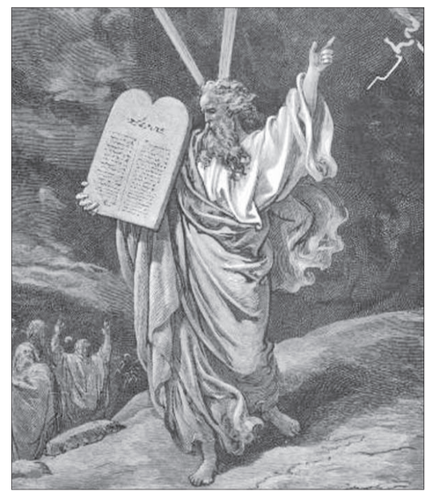
Моисей со скрижалями Закона. Гравюра Постава Доре.