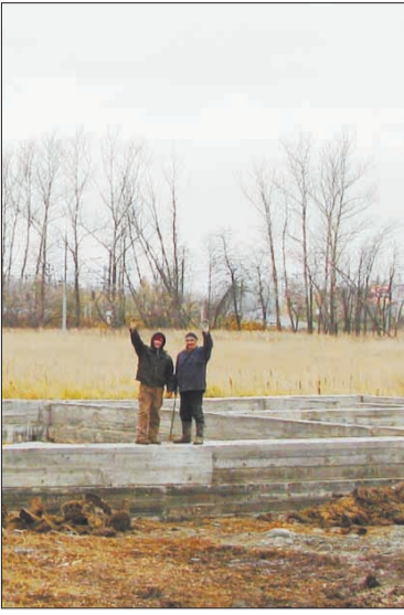
На Храмовом поле.