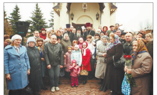
Этот день навсегда останется в памяти.

Это храм маленький – его больше привыкли называть часовней, но сегодня здесь была совершена первая Божественная Литургия, была принесена Бескровная Жертва. И очень символично, что этот храм освящён в память святых Новомучеников ступинских. А их восемнадцать человек, прославивших в лике святых. И город Ступино, город молодой, строился в те годы – в 1937-38-м, когда было самое страшное время гонений на Русскую Православную Церковь. И в то время, когда строился город, эти люди: духовенство, миряне – претерпевали и принимали