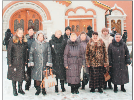
Слушатели Богословских курсов посетили Государственную Третьяковскую галерею.

24 января слушатели Богословских курсов при храме Всех святых в земле Российской просиявших посетили старинные храмы столицы и Третьяковскую галерею.