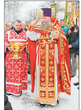
Крестный ход в Починках.

16 ноября следствие было закончено и составлено обвинительное заключение, в котором были оставлены нелепые обвинения священника. 19 ноября 1937 года тройка НКВД приговорила отца Димитрия к десяти годам заключения в исправительно-трудовом лагере. В марте 1938 года родные получили от него письмо со станции Известковской Уссурийской железной дороги, и на этом всякая связь со священником прекратилась. Священник Димитрий