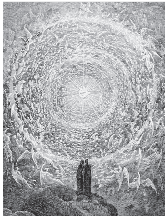
Гравюра Густава Доре.

● В раю у человека остаётся свобода выбора. Но попавший в рай человек всегда выберет пребывание с Богом. Как и у каждого супруга есть выбор, остаться ли в семье и продолжить счастливую семейную жизнь или изменить и разрушить своё счастье. Повторяю,