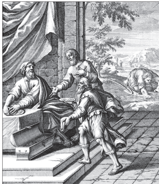
Притча о талантах. Гравюра к Библии 1712 г.

● Святые запрещали отдавать деньги под проценты. Но это было не то же, что мы видим сейчас на примере банковской