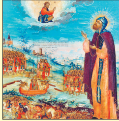
Святой князь Александр Невский.

Нетленные мощи благоверного князя были открыты перед Куликовской битвой – в