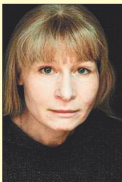
Лауреат Патриаршей литературной премии 2012 г. Олеся Николаева.

«Ещё совсем недавно считалось чем-то само собой разумеющимся, что писатели – это владельцы дум, защитники и выражители высоких нравственных норм. Сегодня на смену традиционной культуре, ориентиро-