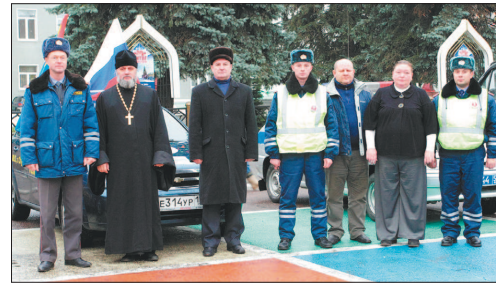
Организаторы и участники акции.