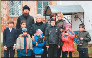
Дети из приюта после Божественной Литургии в Богородице-Рождественском храме.

Ежегодно по благословению митрополита Ювеналия в храмах Московской епархии проходят мероприятия, объединенные девизом: «Согреем детские сердца»