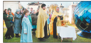
Молебен перед началом работы.

Завершен важный этап обновления Казанского храма с. Киясово Ступинского района: на нем установлен последний купол.