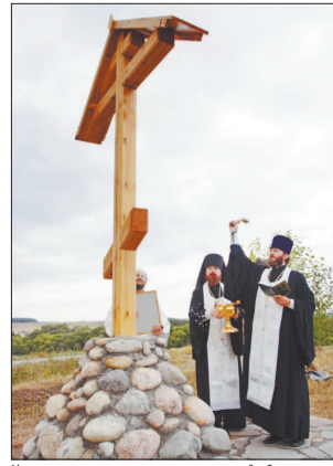
Чин освящения креста на месте древней обители.