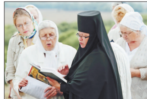
Молитва над святым местом.