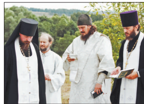
Пока мы помним, мы живы.