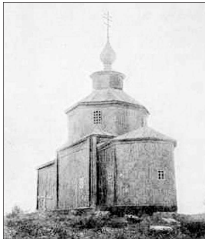
Церковь Преображения в Заворине.

Монастырь имел свои земли, леса и села. Но еще во время