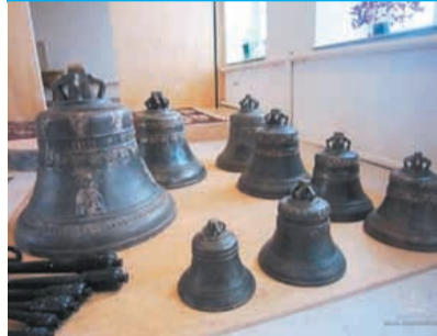
Полный набор колоколов.