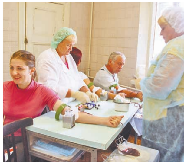
Сдача крови для онкобольных детей.

Трудное выдалось нынче лето. Здоровье многих людей оставляло желать лучшего: из-за дыма пожаров было трудно дышать, жара изнурила и отнимала силы. Вот почему так немного людей в этот раз смогли откликнуться на мольбы о помощи детям, страдающим онкологическими заболеваниями.