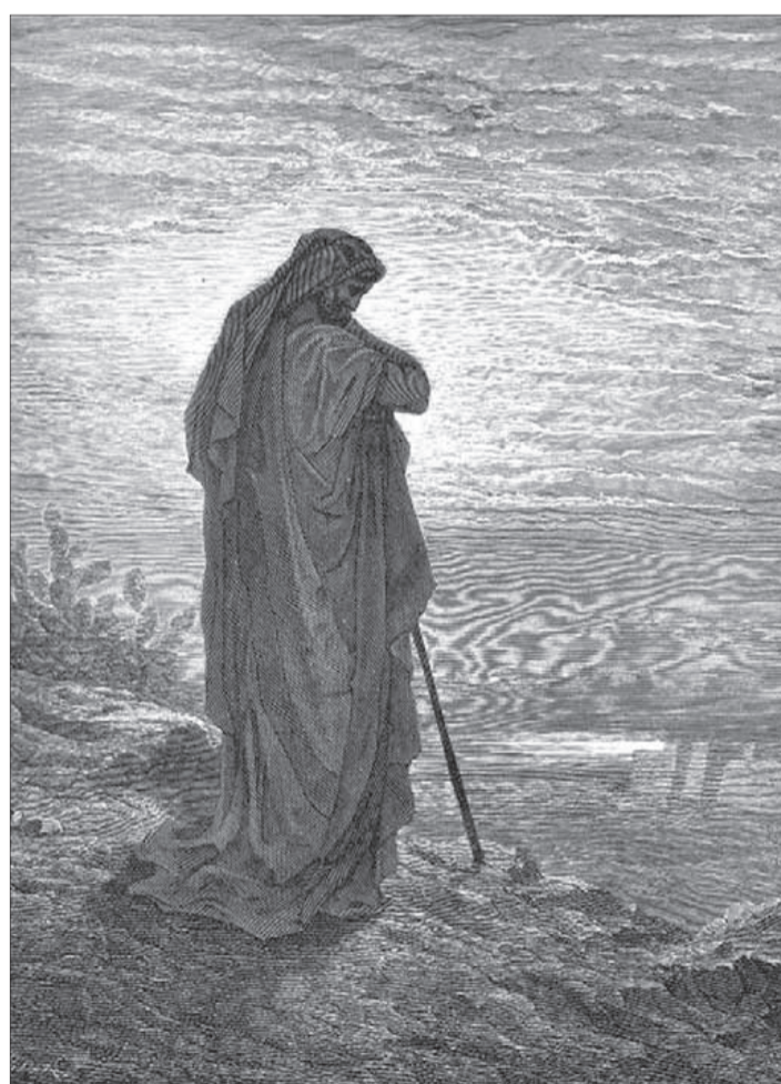
Гравюра к Библии Постава Доре.

Сегодня я хочу коснуться вопроса, уже получившего ответ в истории, но остающегося актуальным для многих до сих пор - это вопрос о почитании святых угодников Божиих. Невоцерковленному человеку трудно понять, зачем нужно молиться святым, ели есть Христос, и почему святые называются ходатаями и посредниками, когда Сам Спаситель в Священном Писании назван единственным Ходатаем и Посредником между Богом и людьми?