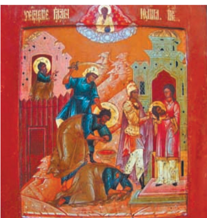
Икона Усекновения Главы Иоанна Предтечи.