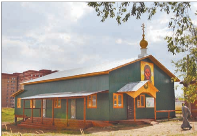
Временный храм на Храмовом поле.

- Сегодня на этом месте была принесена первая Бескровная Жертва. Конечно храм, в котором мы находимся, не блистает своим убранством, не поражает благолепием. Он временный, но это только начало, - сказал отец Благочинный. - Везд Успение Богоматери, как и Воскресение Христово, символизирует поправление смерти и воскрешение к жизни будущего века. С этого времени по воскресным и праздничным дням здесь будут совершаться богослужения,