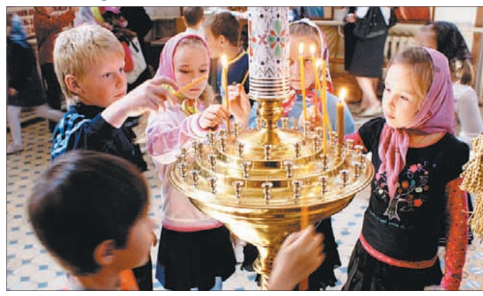
Некоторые ребята побывали в Свято-Троицком Белопесочком монастыре впервые.