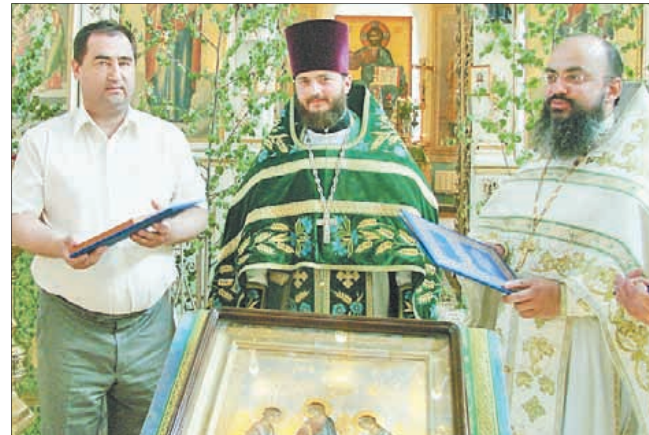
Награждение митрополицими грамотами – волнующий момент юбилейных торжеств.