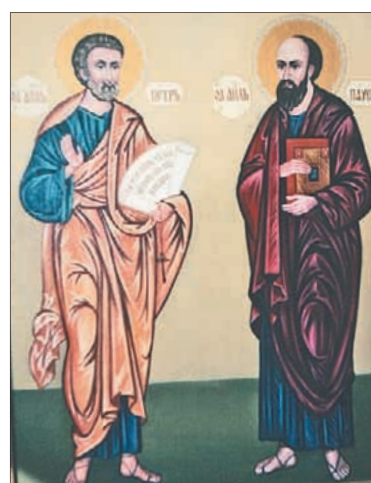
Апостолы Петр и Павел.