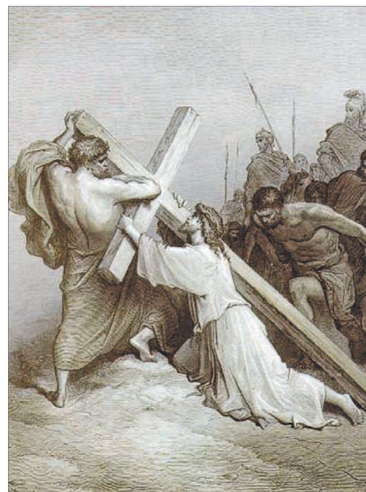
Путь на Голгофу. Гравюра Гостава Доре.

И Слово стало плотью, и обитало с нами, полное благодати и истины; и мы видели славу Его, славу, как Единородного от Отца (Ин. 1, 14). Эта строка Евангелия от Иоанна говорит о том, что Бог Слово, Второе Лицо Пресвятой Троицы стало плотью, то есть человеком. На этих словах основывается вся наша вера. Как Бог стал человеком? Для чего? Что значит «стал человеком»? Если мы не понимаем этого, то не понимаем, что такое христианство и для чего оно появилось.