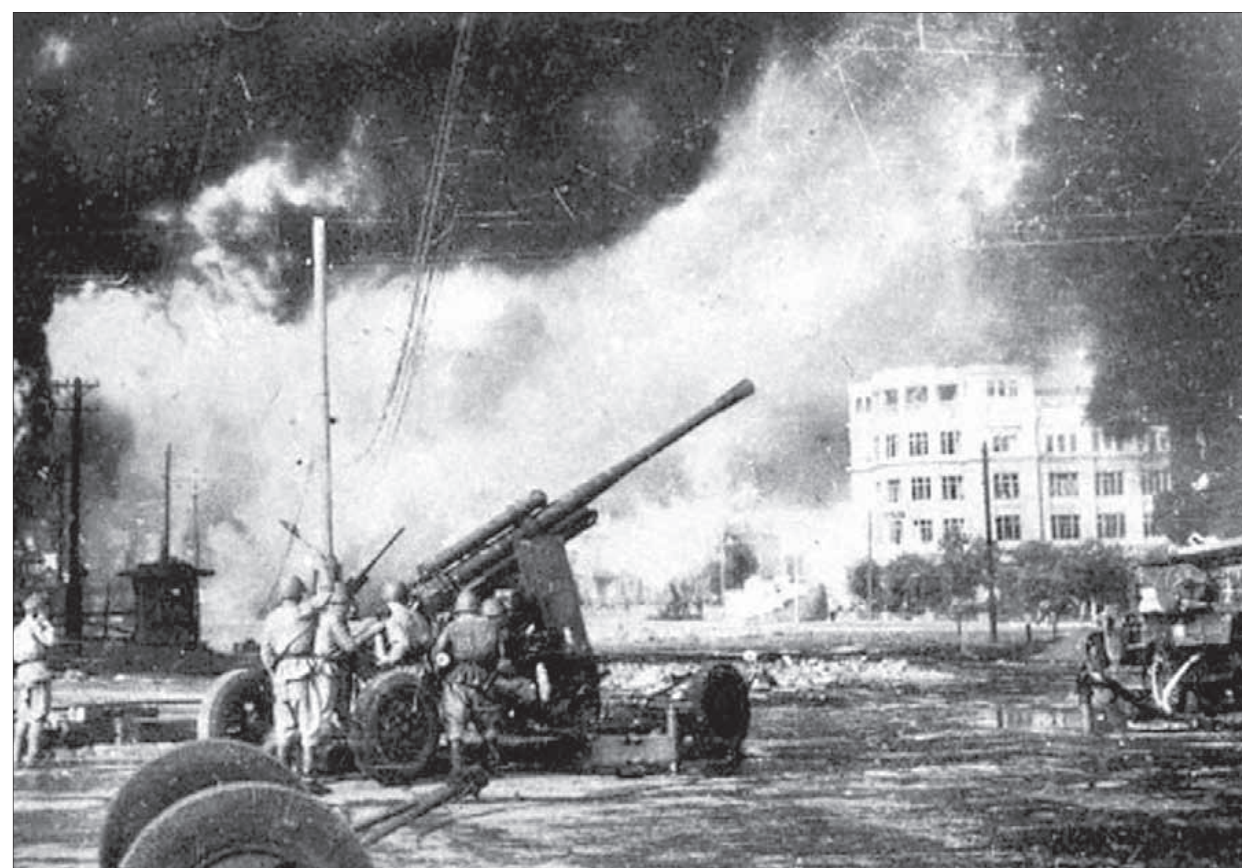
Горящий Сталинград. Зенитная артиллерия ведёт огонь по немецким самолётам.

Его судьба определилась, когда он нашёл в груди кирпичей в развалинах сталинградского дома старую книгу. Начал читать — и почувствовал, как вспоминал он потом, «что-то такое родное, милое для души» — это было Евангелие. Он собрал все его листочки и больше уже не расставался с найденной Книгой.