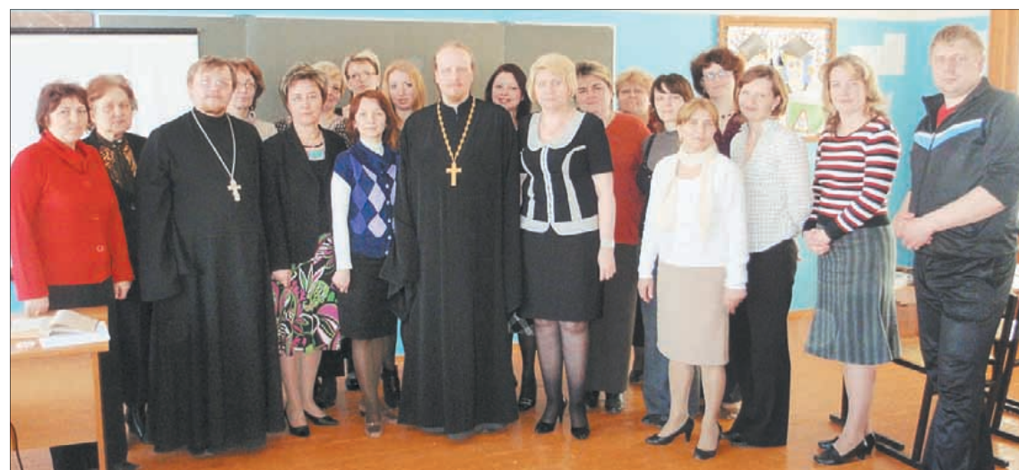
Участники педагогического совета.

93 % родителей считают, что их дети должны ознакомиться с основами право-