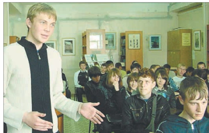
Молодое поколение — обладатели драгоценного наследия родной словесности.

Ребята не останавливаются на достигнутом. Впереди — выставка к 130-летию освящения Преображенского храма в пос. Михнево.