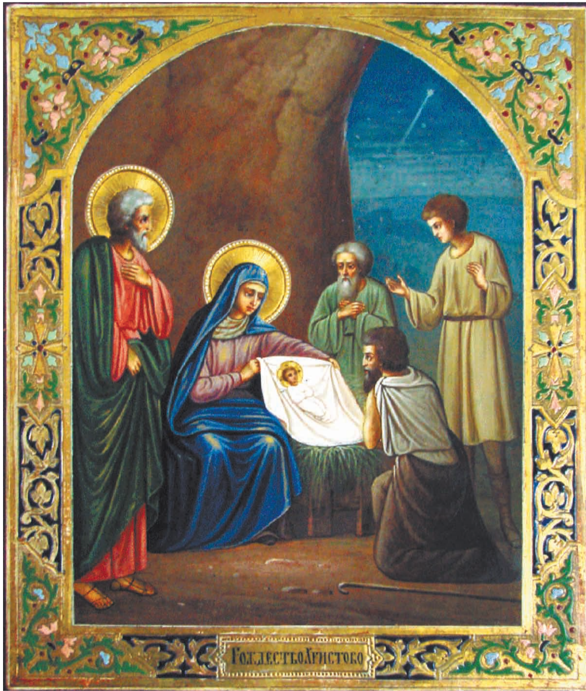
Икона Рождества Христова.

Исполненными глубокого символического смысла были обстоятельства смиренного и неприметного Рождества в Вифлееме. Убогой была пещера, и в скромности совершали жизненный путь Пресвятая Богородица и праведный Иосиф Обручник. Поклониться Рождшемуся Богомладенцу в те дни пришли лишь восточные мудрецы, издревле ожидавшие