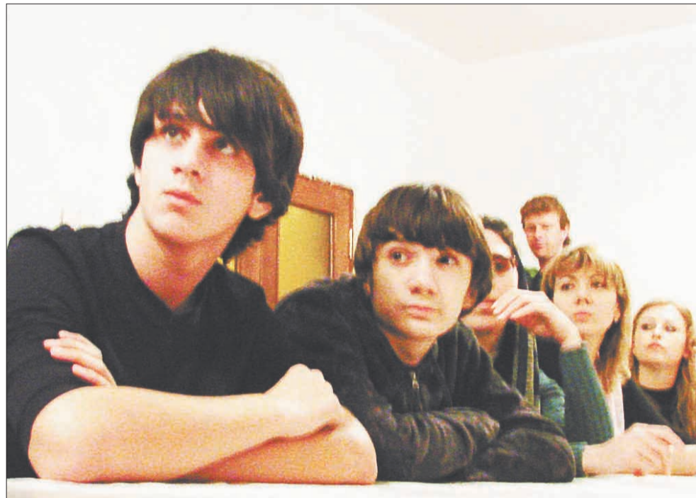
Участники диспута. Членами дискуссионного клуба могут стать все, кто интересуется вопросами православной веры.

Начиная с сентября текущего года, при Тихвинской церкви с. Среднее работает молодёжный дискуссионный клуб. Впрочем, слово «молодёжный» не ограничивает тех, кто, перешагнув порог 35-летия, хочет побывать на заседаниях клуба, послушать, а возможно, и обменяться взглядами по предложенным на обсуждение вопросам.