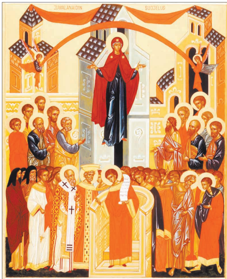
Икона Покров Пресвятой Богородицы.

С давних времён на Руси этот праздник почитался особо, и в честь него освящались приделы и возводились многочисленные Покровские храмы. Многие события в истории нашего Отечества свидетельствуют о том, что Пресвятая Богородица всегда помогает и спасает в трудных и, казалось бы, отчаянных обстоятельствах, осеняя нашу землю и наш народ Своим святым омофором.