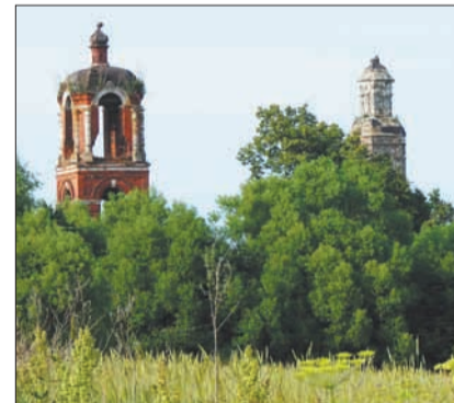
Покровская церковь с. Авдулово.

На территории храма стоит заросший колодец, который когда-то славился чистой водой. Называли его «Три ручья», и сейчас мало кто помнит, что освящал этот колодец священник Михаил Успенский, бывший в то время настоятелем Покровского храма, а ныне причисленный к лику святых новомучеников. В день субботника колодец