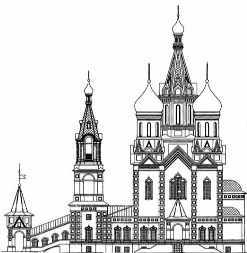
Проект собора в Ступине.