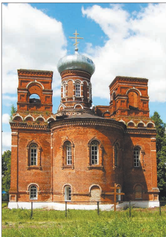
Покровская церковь с. Марьинское.

В день Покрова Пресвятой Богородицы престольный праздник отмечает Покровский храм в селе Марьинское. В этом году храм отмечает небольшой юбилей – 105 лет со дня освящения.