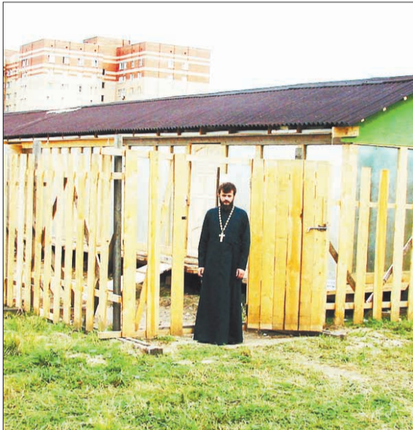
На строительной площадке идёт освоение территории.